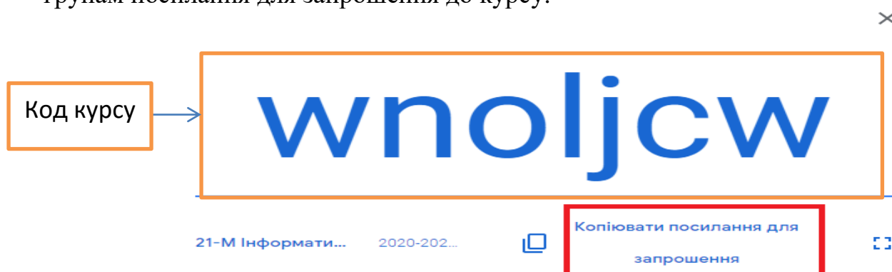
Рис.2. Перегляд коду курсу.

Після створення курсу повідомте код курсу студентам або розішліть групам посилання для запрошення до курсу.