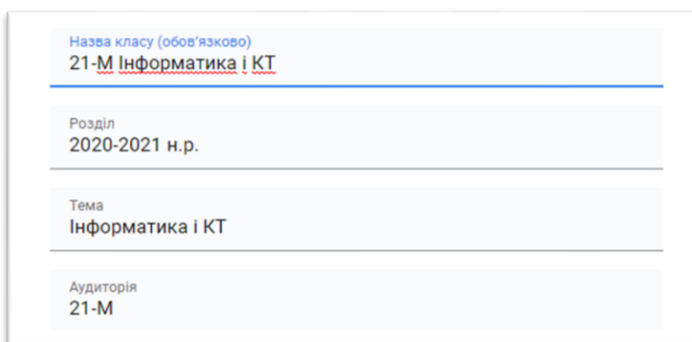
Рис.1. Створення курсу.